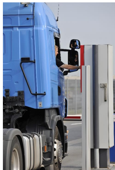
Bedienung des Terminals direkt aus dem Fahrzeug