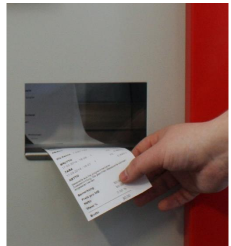
Logistic Terminal mit Belegausgabe