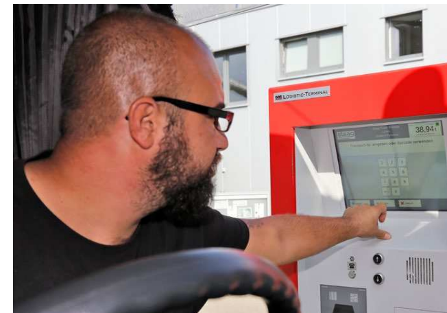
Alle Informationen zur Abholung sind für die Fahrer direkt über die neuen Terminals abrufbar – und das direkt aus dem Lkw-Fahrerhaus